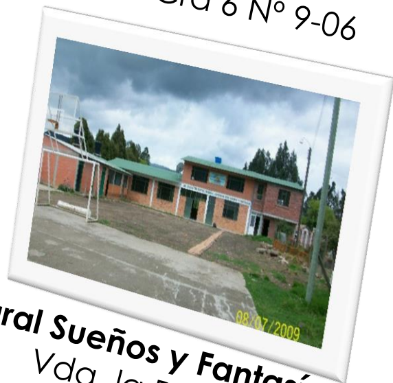
Rural Sueños y Fantasías. Vda. la Patera.