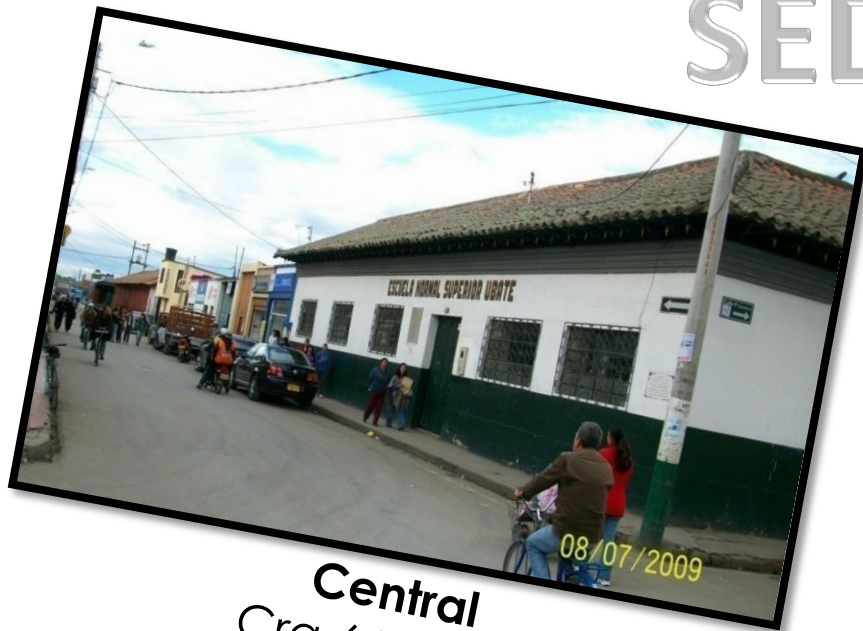
Central Cra 6 N° 9-06