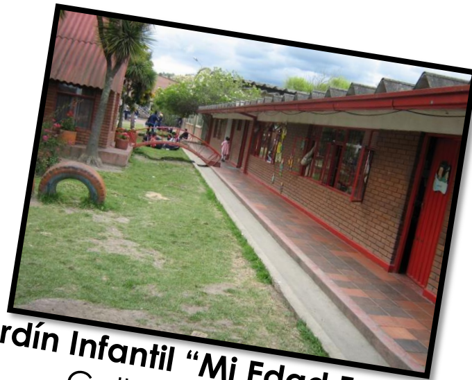
Jardín Infantil "Mi Edad Feliz" Calle 10 N° 5.01