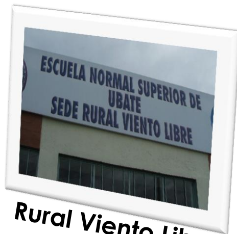
Rural Viento Libre